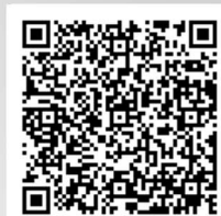
↓ 3カメラ収録による映像 (DVD) ↓